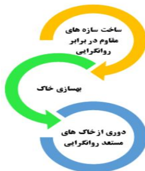
شکل ۲: روش های مقابله با روانگرایی خاک در خاک مستعد روانگرایی